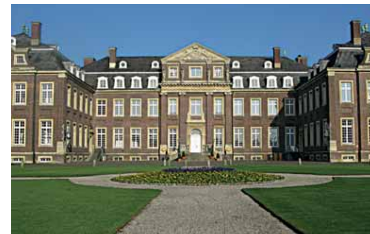
Layout: Sylvia Trau, Münster

Am Hagenbach 11 | 48301 Nottuln-Darup | Tel. 02502 9012310 www.naturschutzzentrum-coesfeld.de info@naturschutzzentrum-coesfeld.de